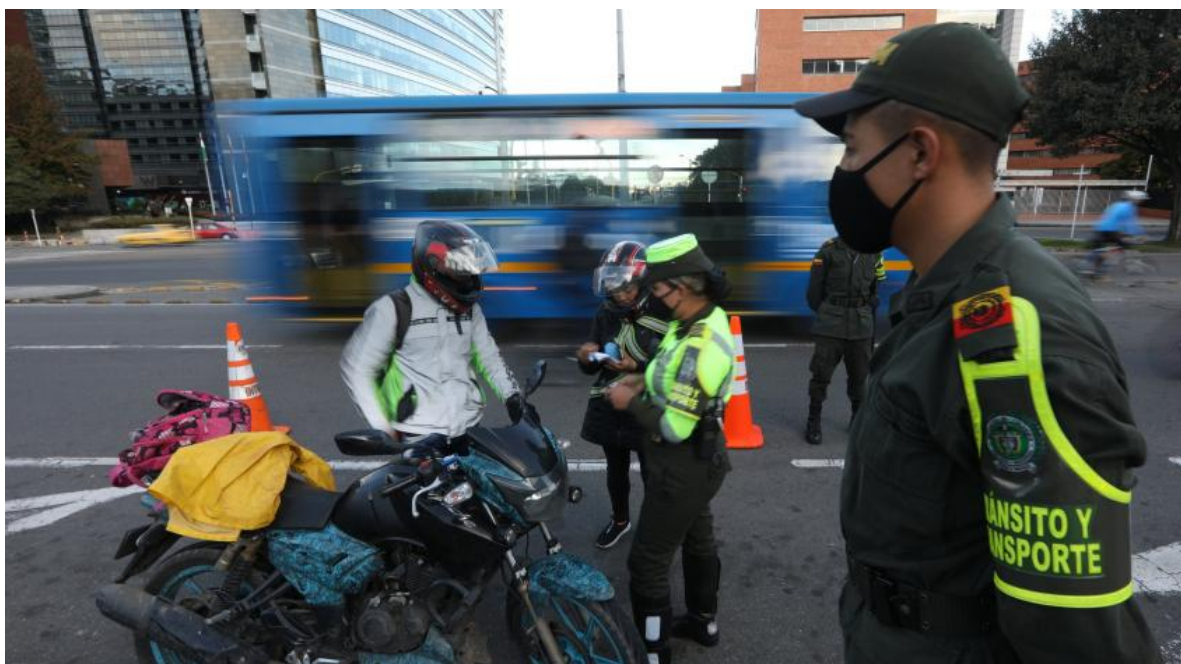
La Policía Metropolitana de Bogotá ha fortalecido los puntos de control en vías en la ciudad.

RELACIONADOS: BOGOTÁ | INSEGURIDAD EN BOGOTÁ | MOTOS | CLAUDIA LÓPEZ | PARRILLERO